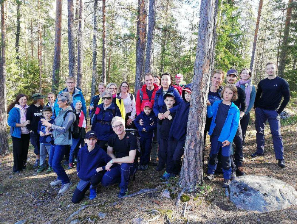
Herbstwanderung in Nuuksio/Kattila

Hyvät Suomi-Itävalta-yhdistyksen jäsenet!